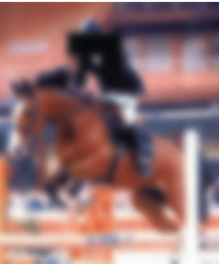
Het paard is zo'n 12.500 euro waard.

Uit een weide in de Sparappelstraat in Torhout werd onlangs het jumpingpaard 'Powerboy' gestolen. Het gaat om een donkerbruine ruim met een witte bles en witvoeten. Het paard, dat meedoet aan toernooien, is meer dan 12.500 euro waard. Het paard draagt het chipnummer 981100000601871. Wie meer weet over deze diefstal, kan contact opnemen met Adri Hauquier via 0486/06.28.29 of adri.hauquier@paardenspeurder.be. Meer info: www.paardenspeurder.be. (KLZ)